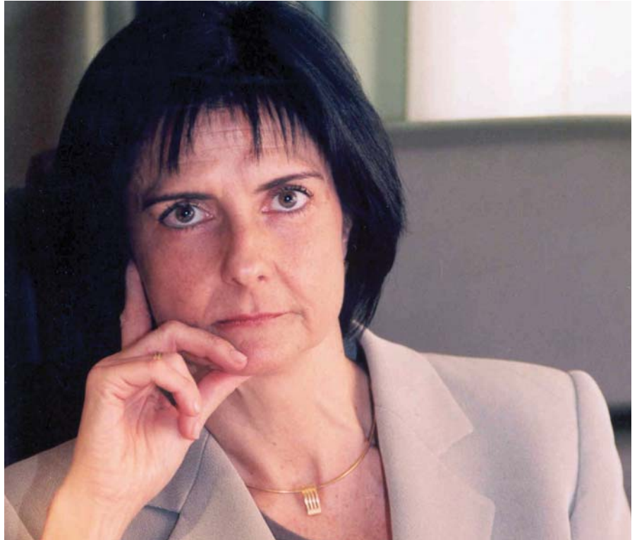
Montserrat Comas, Presidenta del Observatorio.

Además de estas medidas de auxilio, y en el marco de las Medidas de Protección Integral contra la Violencia de Género, el CGPJ adoptó, por acuerdo de Pleno, a finales del pasado mes de abril, atribuir a un solo órgano judicial en cada uno de los Partidos Judiciales de España (431 en total) “el conocimiento de las materias en violencia sobre la mujer” .