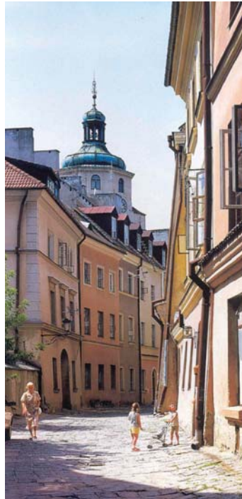
Plaza del Mercado y una de las calles del casco antiguo de Lublin (Polonia).

El Comité Director del Consejo de Municipios y Regiones de Europa (CMRE), cuya Sección Española es la FEMP, participó en los actos conmemorativos del sexagésimo aniversario del final de la II Guerra Mundial, durante la reunión que celebró los pasados días 8 y 9 de mayo en la ciudad polaca de Lublin. Dichos actos cobraron en Lublin un significado especial ya que es en esta ciudad donde estuvo funcionando a lo largo de la guerra el campo de concentración de Madjanek, en el que fueron asesinadas por los nazis alrededor de 250.000 personas, la mayoría de ellas, de origen judío.