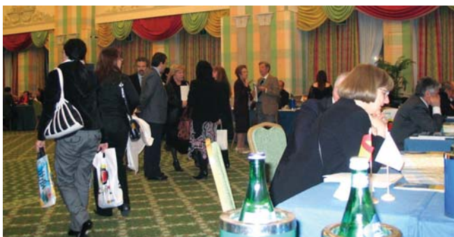
Aspecto de la sala de trabajo de Roma, durante la presentación.

“ Más de 150 operadores turísticos italianos acudieron a las presentaciones que el SCB realizó en Roma y Milán ”