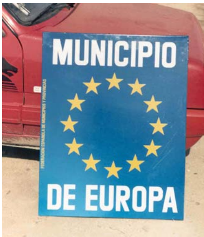
Numerosos Ayuntamientos participaron en la campaña Municipio de Europa.

El Comité de las Regiones está compuesto de 222 representantes de Entidades Locales y Regionales. En el caso de España, desde su constitución, cuenta con 21 representantes, uno por cada Comunidad Autónoma y cuatro representantes de Entidades Locales; la composición de la Delegación española, por una Resolución del Senado, la nombran