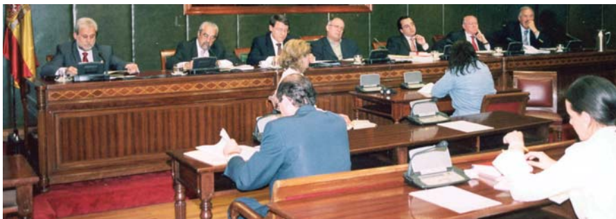
Jordi Sevilla en la Comisión de Entidades Locales del Senado.

En este mes de junio será presentado el segundo borrador del Libro Blanco sobre la reforma del Gobierno Local, que contará con buena parte de las aportaciones realizadas por los poderes locales españoles, con el fin de que el Proyecto de Ley que contenga las reformas del régimen local esté presentado antes de que finalice el año; así lo anunció el Ministro de Administraciones Públicas, Jordi Sevilla, durante su comparecencia ante la Comisión de Entidades Locales del Senado. Asimismo, anunció la intención del Gobierno de introducir el debate sobre haciendas locales en la reforma del modelo de financiación autonómica y que los nuevos Estatutos de Autonomía recojan los intereses municipales.