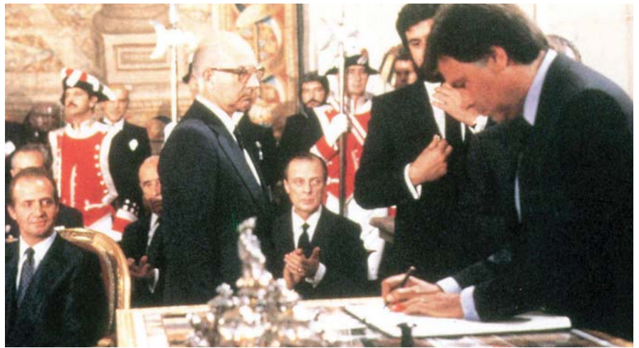
Firma del Tratado de Adhesión de España en el Palacio Real de Madrid.

La incorporación de España a Europa supuso la entrada de nuestro país en la normalidad democrática institucional, en el progreso y la modernización. España inició, desde entonces, un camino hacia la convergencia con nuestros países vecinos, con un crecimiento superior a la media, unas cuentas públicas saneadas y un ritmo sostenido de creación de empleo, un pro-