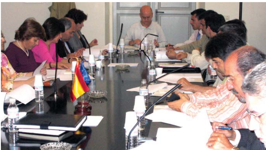
La Comisión de Participación Ciudadana, en su última reunión, celebrada en la FEMP.