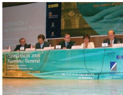
Plenario de la Asamblea

segundo en la Diversidad Municipal -principalmente los pequeños municipios y las Diputaciones-, en los diversos Modelos de Participación Ciudadana, y