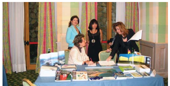
Mesa de trabajo del Ayuntamiento de San Sebastián.