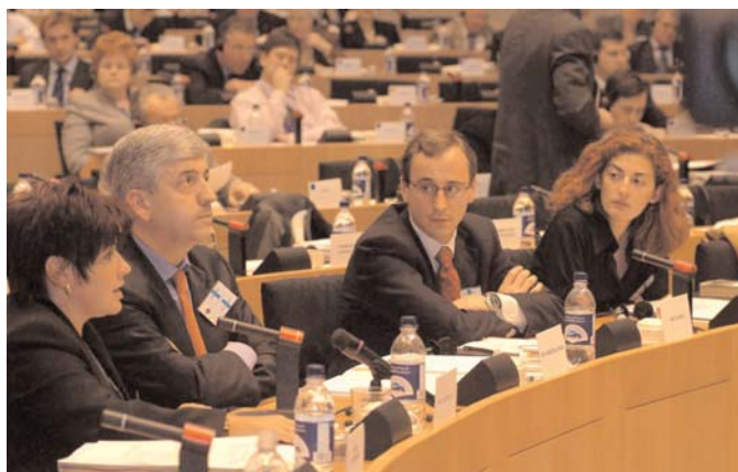
Representación española en la 49 Sesión del Comité de las Regiones que aprobó una Resolución de apoyo a los Concejales y Alcaldes españoles amenazados por el terrorismo.

las Comunidades Autónomas y la FEMP. La representación local es de cuatro titulares y cuatro suplentes, entre ellos el Presidente y las dos Vicepresidentas de la FEMP; la Delegación es nombrada formalmente el Gobierno de cada país cada cuatro años, y la próxima renovación se producirá en febrero de 2006.