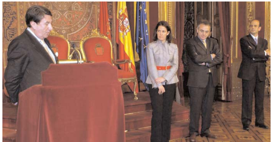
El Presidente de la FEMP durante la recepción en el Gobierno de Navarra.

Igualmente, demanda suficiencia financiera para cumplir con sus funciones. También contiene la demanda de una organización pública fuertemente descentralizada y el incremento de la Cooperación Local con la Administración del Estado y las Comunidades Autónomas, a